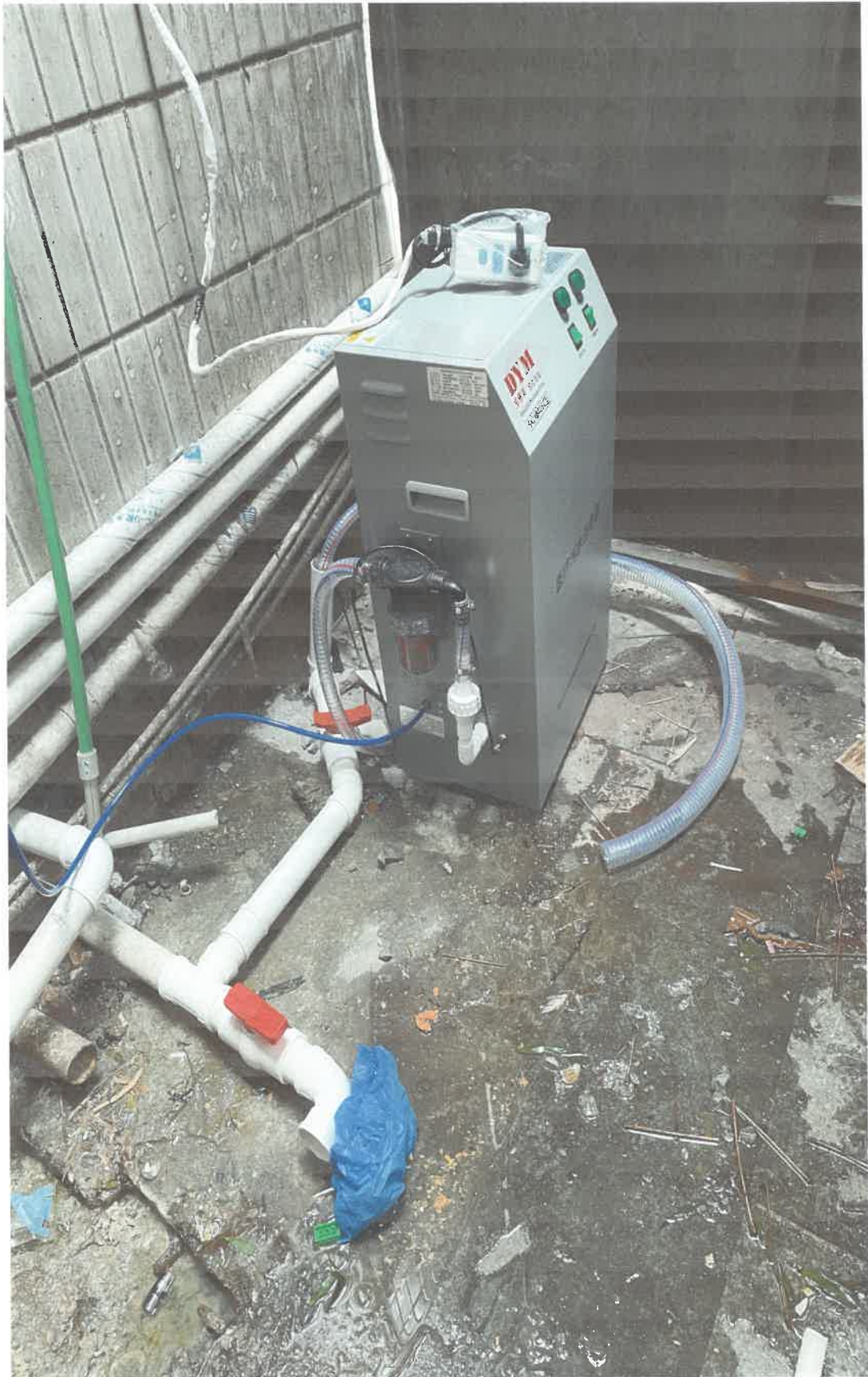
健齿口腔诊所污水处理设备 2022年2月14日