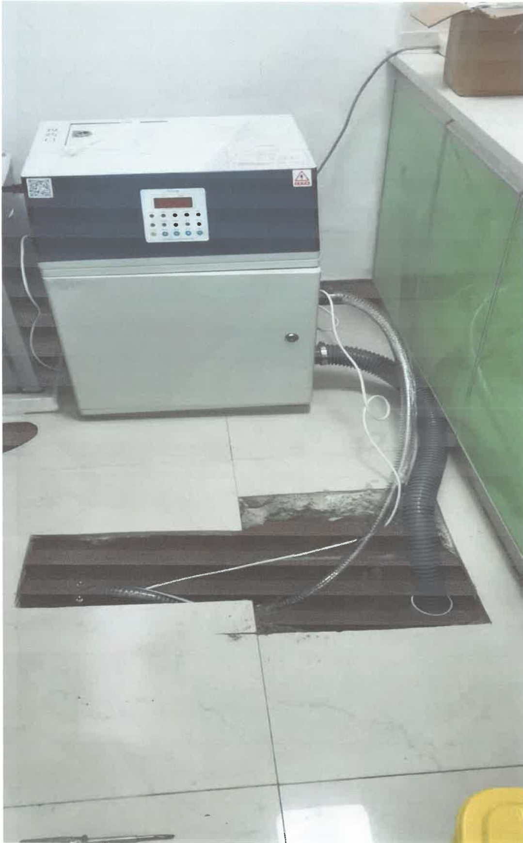
崎美口腔诊所污水处理设备①