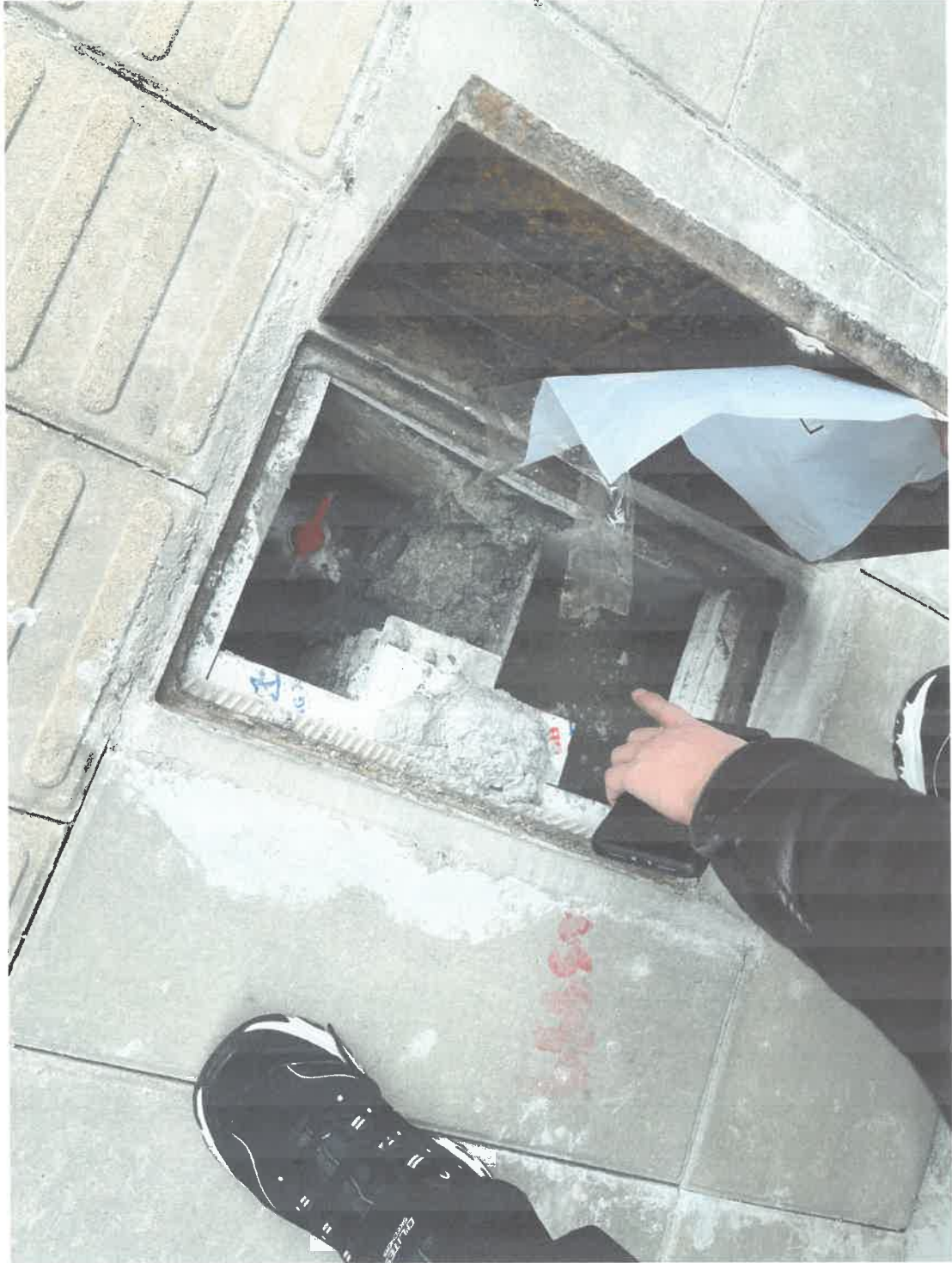
牙之友口腔诊所 3月1日