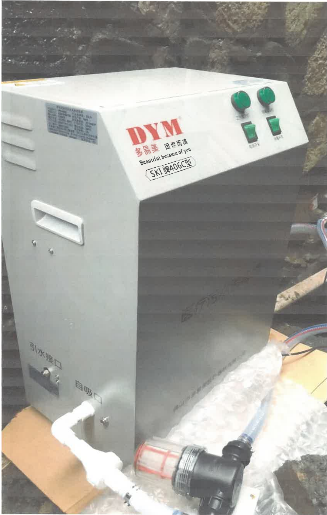
阳光口腔诊所污水处理设备 2022年2月10日